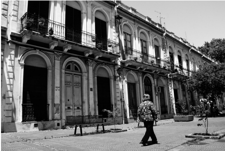
Calle Emilio Reus