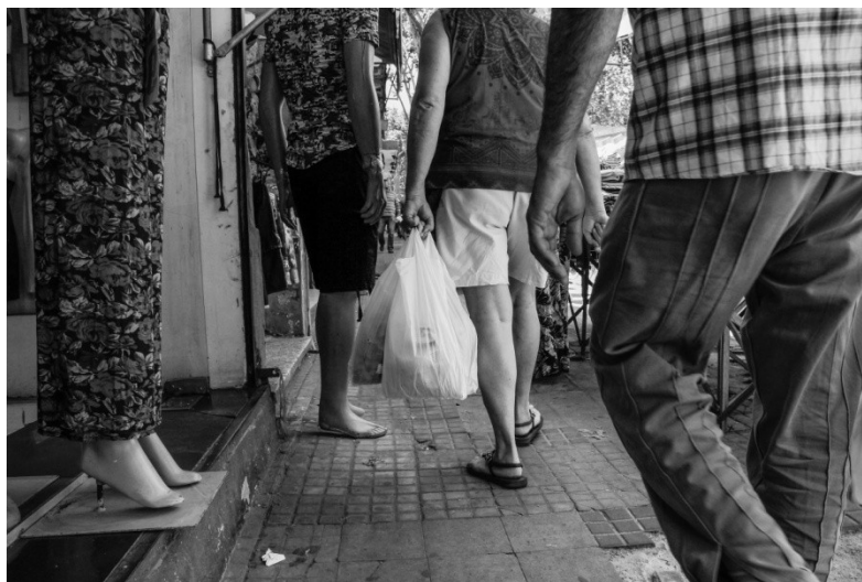
Compradores transitan en su mayoría por la calle Arenal Grande

Los espacios públicos existentes son escasos, en su mayoría plazoletas triangulares a lo largo de Arenal Grande, durante la semana son acaparados por puestos, usados como si fueran estanterías del comercio o depósito de algún local comercial.