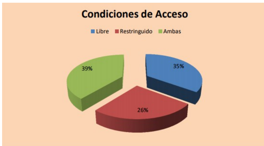
Gráfico de las condiciones de acceso:

Las condiciones de Acceso en cada organización pública o privada pueden variar desde lo que es el acceso libre a restringido o tener la posibilidad de ambos dependiendo del tipo de documentación del que se trate.