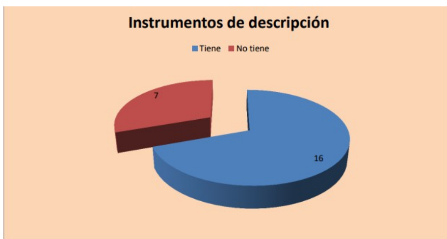
Gráfico Instrumentos de Descripción:

Los instrumentos de descripción son una herramienta básica de la Archivología. Este gráfico compara que instituciones cuentan con este instrumento y cuáles no.